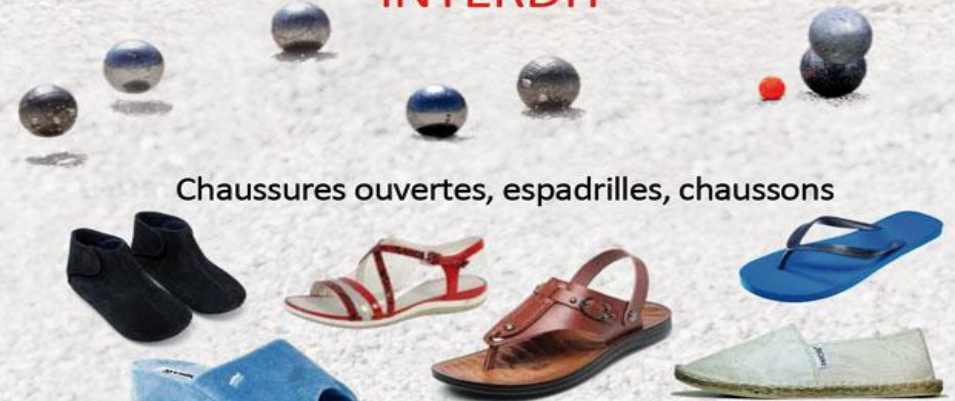
Chaussures ouvertes, espadrilles, chaussons