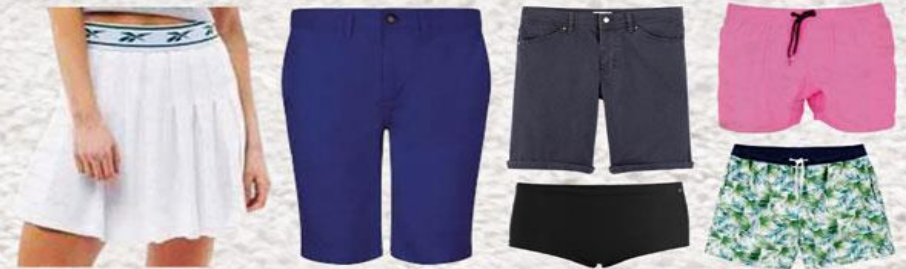
Shorts de bain, jupe, robe, bermudas de ville...