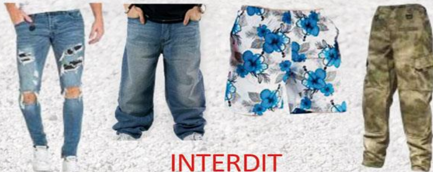
Vêtements troués, délavés, cloutés, bariolés...